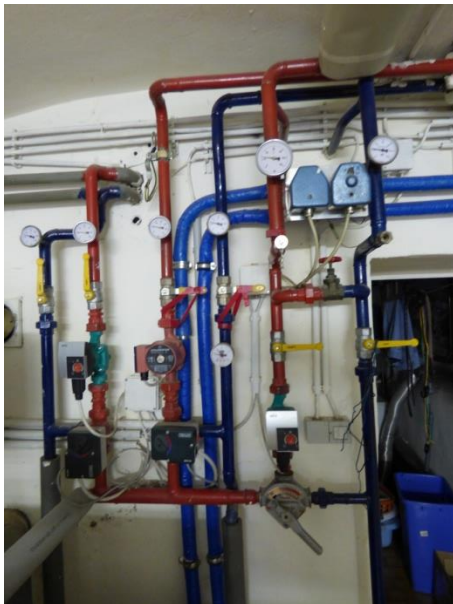
7. Verteiler in der Totalen