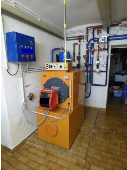
1. Heizraum von der Türe aus in der Totalen

Bitte senden Sie uns von Ihrer Heizungsanlage folgende Fotos im jpg Format: