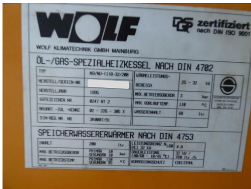
5. Typenschild des Kessels (bitte nicht mit Blitzlicht fotografieren, dieses spiegelt sehr stark)