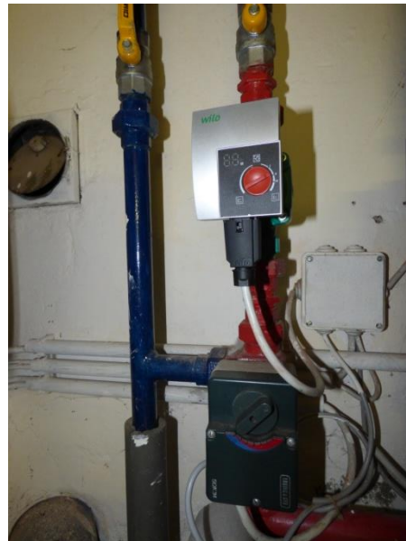
8. Jeden Heizkreis einzeln