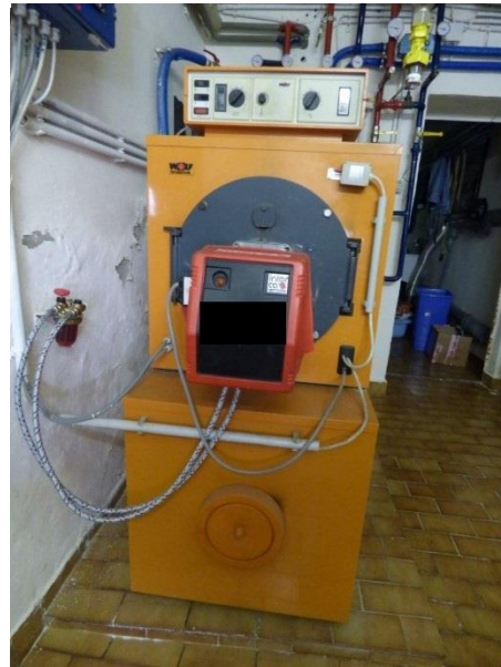
2. Kessel / Therme von vorne möglichst ganz zu sehen