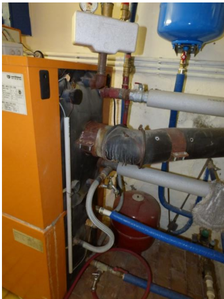
3. Kesselanschlüsse hydraulisch (oder Thermenanschlüsse unter der Therme)