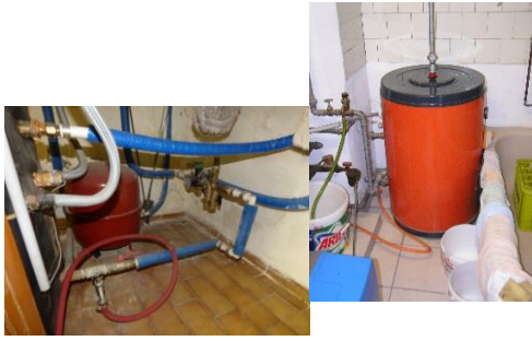
9. Speicher und Speicheranschlüsse (im Bild links Unterstellspeicher), oft sind auch nebenstehende Speicher vorhanden wie im rechten Bild