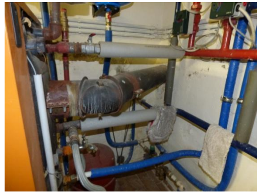
6. Abgasleitung vom Kessel bis zum Kamin