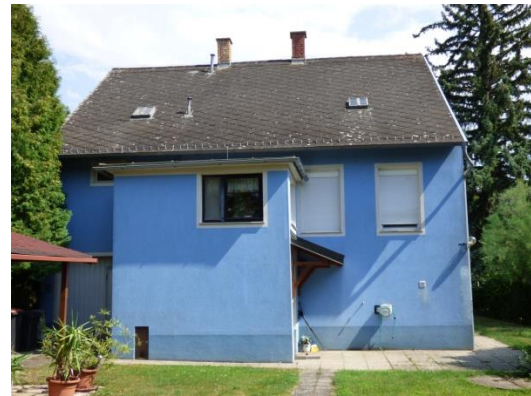
12. Von Außen: Komplette Haushöhe vom Erdboden bis zum Kaminabschluß/ Außenwandanschluß