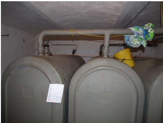
11. Öltank samt Ölleitung oder Gaszähler wenn vorhanden