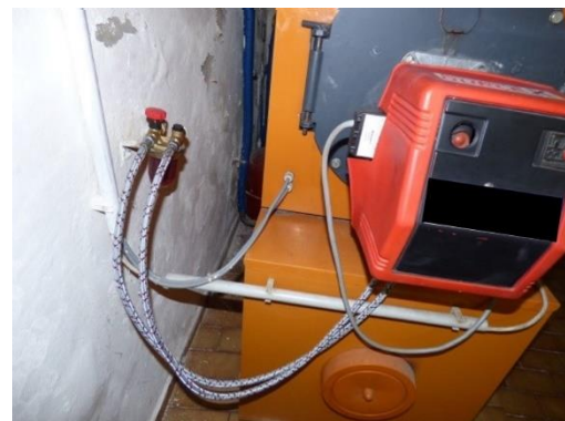
4. Kesselanschlüsse brennstoffseitig (Gasleitung, Ölleitung)